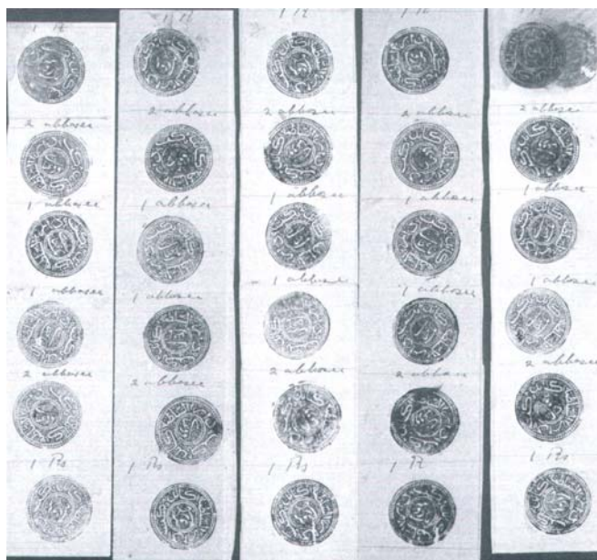
Pět svislých šestipásek ručně ražených známek na papírech rozdílných barev (ružová, žlutá, modrá, červená a zelená) z období 1884–1890, tedy z doby, kdy v Afghánistánu nebyla žádná tiskárna.