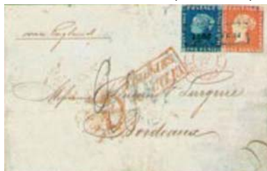
Unikátní dopis s modrým a červeným „Mauritiem“