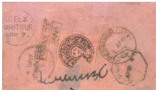
Obálka se známkou 1 shahi, vydražená za 5 063 CHF.

Tyto materiály se poté objevily ve větší míře na aukci Christie's Robson Lowe 19. 5. 1988, kdy se dražila sbírka již zmiňovaného majora Hopkinse. Uvedeme si několik ukázek z této aukce: