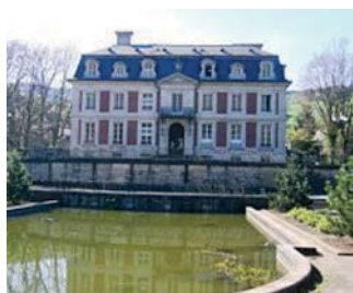
Burrusovo sídlo v Saint Croix-aux-Mines

Maurice Burrus se narodil 8. 4. 1882 v Dambachu v podnikatelské, dobře situované rodině. Už od dětství propadl kouzlu poštovní známky a protože díky silnému finančnímu zázemí se nemusel příliš ohlížet na ceny známek, měl už v mládí velmi kvalitní a rozsáhlou sbírku.